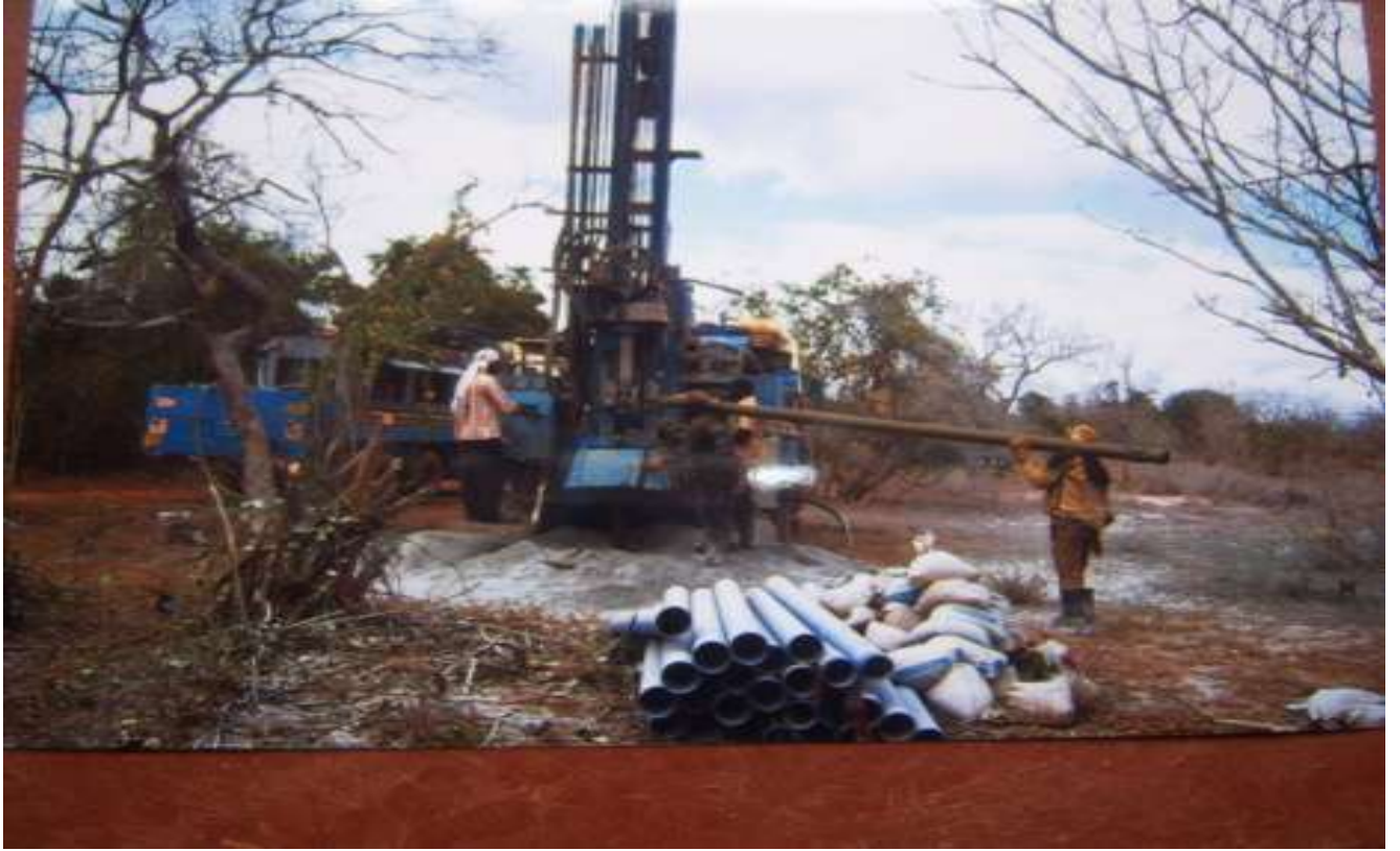
2 nd site water after 120meters we got water 2013