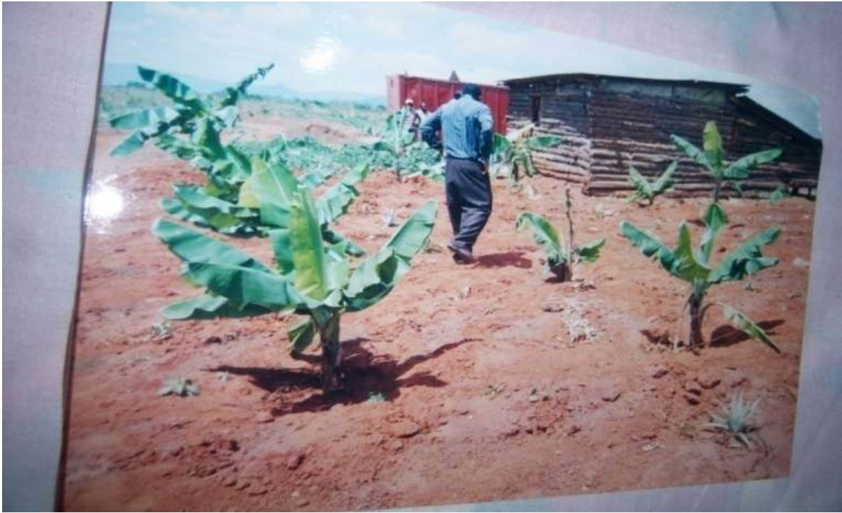
26/3/2003: Planning and new structure – iliandaliwa na Mr. Lusungu from Tanga municipal.